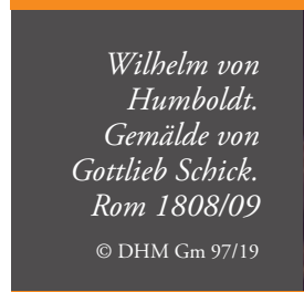
Wilhelm von Humboldt. Gemälde von Gottlieb Schick. Rom 1808/09