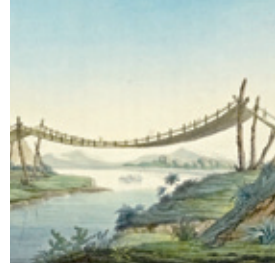
Seilbrücke bei Penipe. Vues des Cordillères, Paris 1810

Ihre wissenschaftliche Tätigkeit stellt die Gesellschaft in öffentlichen Tagungen an wechselnden Orten dar. Nehmen Sie zweimal jährlich