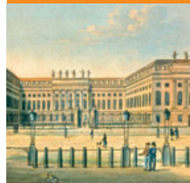
Humboldt- Universität um 1810