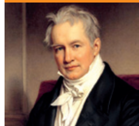
Alexander von Humboldt. Gemälde von Joseph Karl Stieler. Berlin 1843