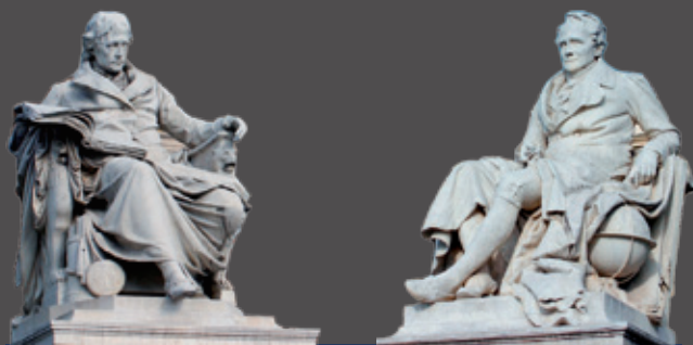
Wilhelm von Humboldt 22.6.1767 – 8.4.1835

EIN DISKURS DURCH NATURWISSENSCHAFTEN, GEISTESWISSENSCHAFTEN, KUNST UND BILDUNG.